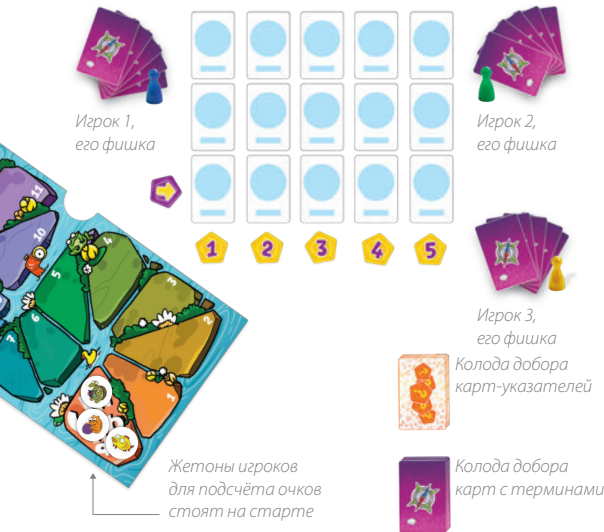
Игрок 1, его фишка