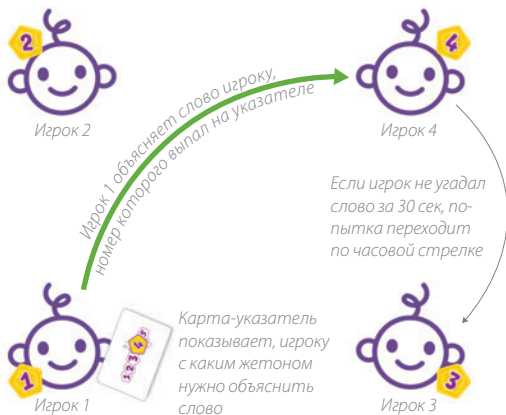
Рис. 4. Если игрок не смог угадать слово за 30 сек, попытка переходит следующему игроку по часовой стрелке.

5. Ход переходит к следующему игроку в двух случаях: