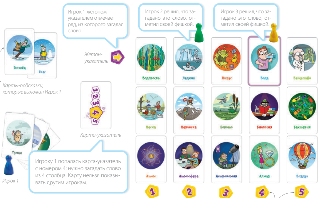
Карты-подсказки, которые выложил Игрок 1