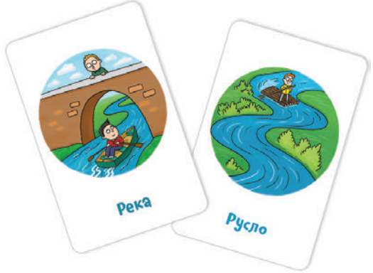
Рис. 5. Например, эти карты похожи тем, что на них мальчик плывёт по реке.

Если игрок не может найти у себя подходящую карту или не может объяснить, как карты связаны между собой, то он пропускает ход.