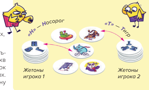
Рис. 2. Первый вариант игры

Задача игроков — найти на столе жетон с объектом, который начинается на одну из букв на верхнем жетоне игрока. Новый жетон игрок кладёт наверх своей стопки буквами вверх. Теперь нужно найти новый объект на одну из этих букв.