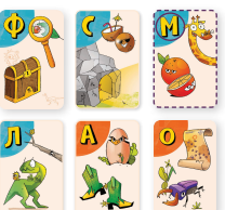
Карты игрока 2