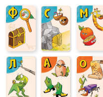
Карты игрока 2

Если у игрока несколько одинаковых букв или одна и та же буква есть у нескольких игроков, они все переворачивают свои карты.