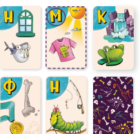
Карты игрока 1