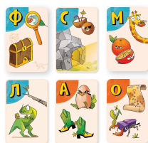
Карты игрока 2