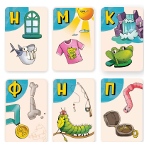
Карты игрока 1