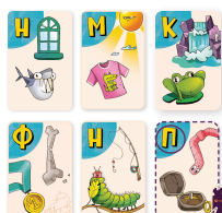
Карты игрока 1