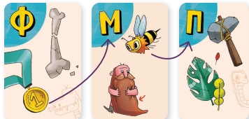
Медаль → М → пчела → П

Игроки ходят по очереди, начиная с самого младшего. В свой ход игрок пытается построить наиболее длинную цепочку «буква-картинка», используя центральную карту и карты с руки.